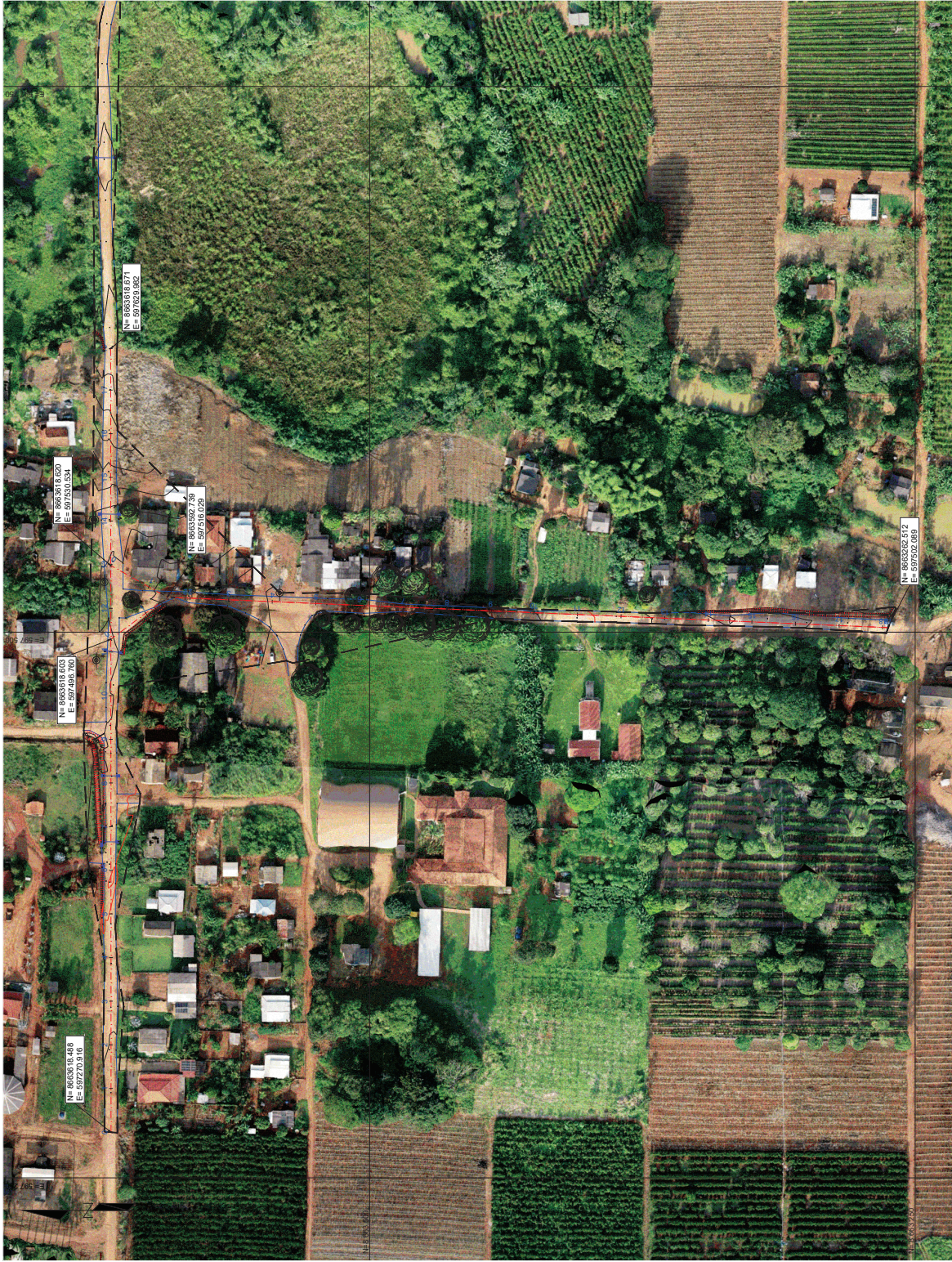
PLANTA Esc 1:1000